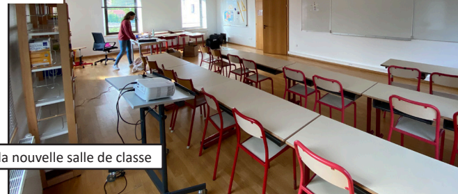
Préparation de la nouvelle salle de classe