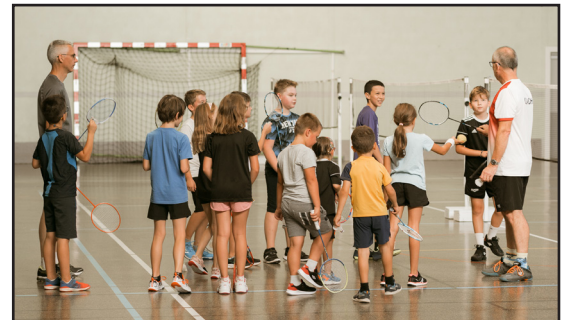
La rentrée du 1 er groupe (5-10 ans)

Les inscriptions ont eu lieu début septembre comme tous les ans, mais vous pouvez nous rejoindre à n'importe quel moment de la saison sportive 2023/2024 à Morschwiller ou Berstheim selon votre convenance, lors de nos 4 séances pour les adultes, ou à Berstheim les samedis matins de 9h à 10h30 pour les petits de 5 à 10 ans et de 10h30 à 12h pour les 11-16 ans.